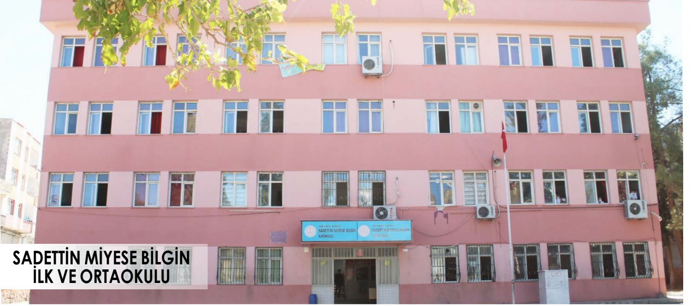
SADETTİN MİYEŞE BİLGİN İLK VE ORTAOKULU