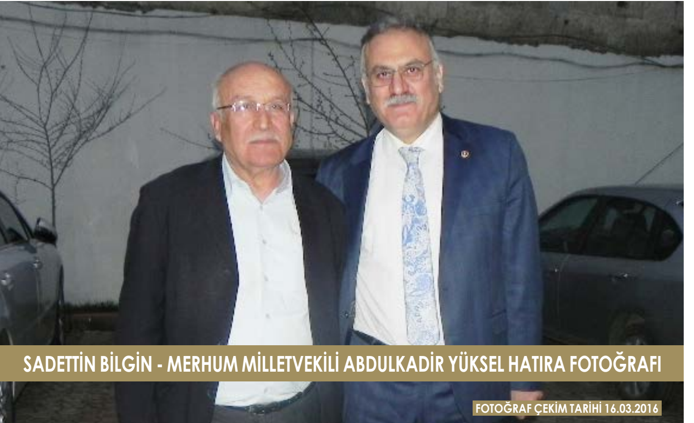
SADETTİN BİLGİN - MERHUM MİLLETVEKİLİ ABDULKADİR YÜKSEL HATIRA FOTOĞRAFI