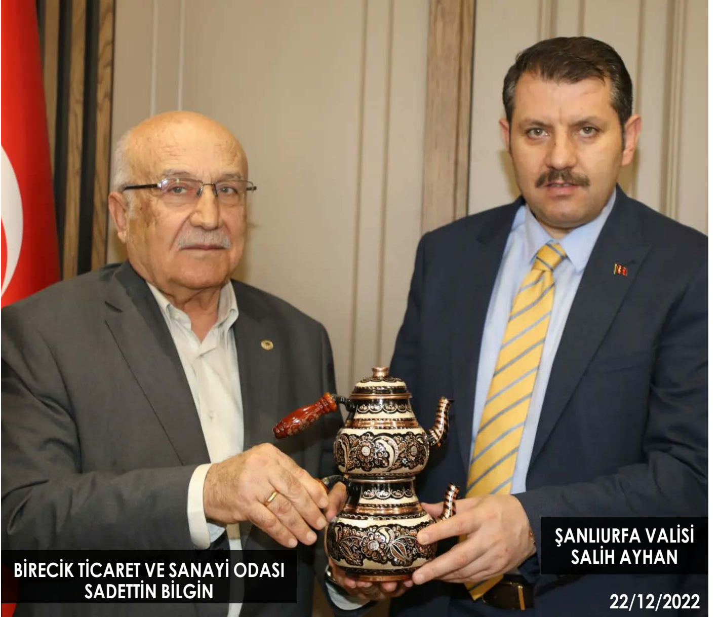
BİRECİK TİCARET VE SANAYİ ODASI SADETTİN BİLGİN