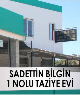
SADETTİN BİLGİN 1 NOLU TAZİYE EVİ