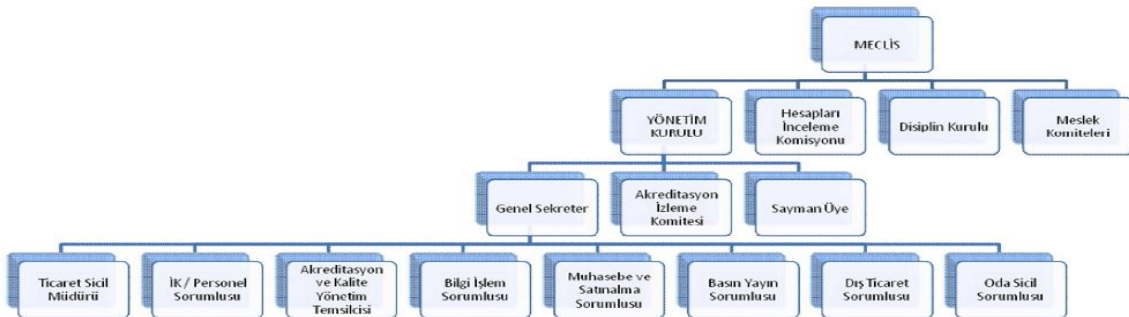
BİRECİK TSO Organizasyon Şeması